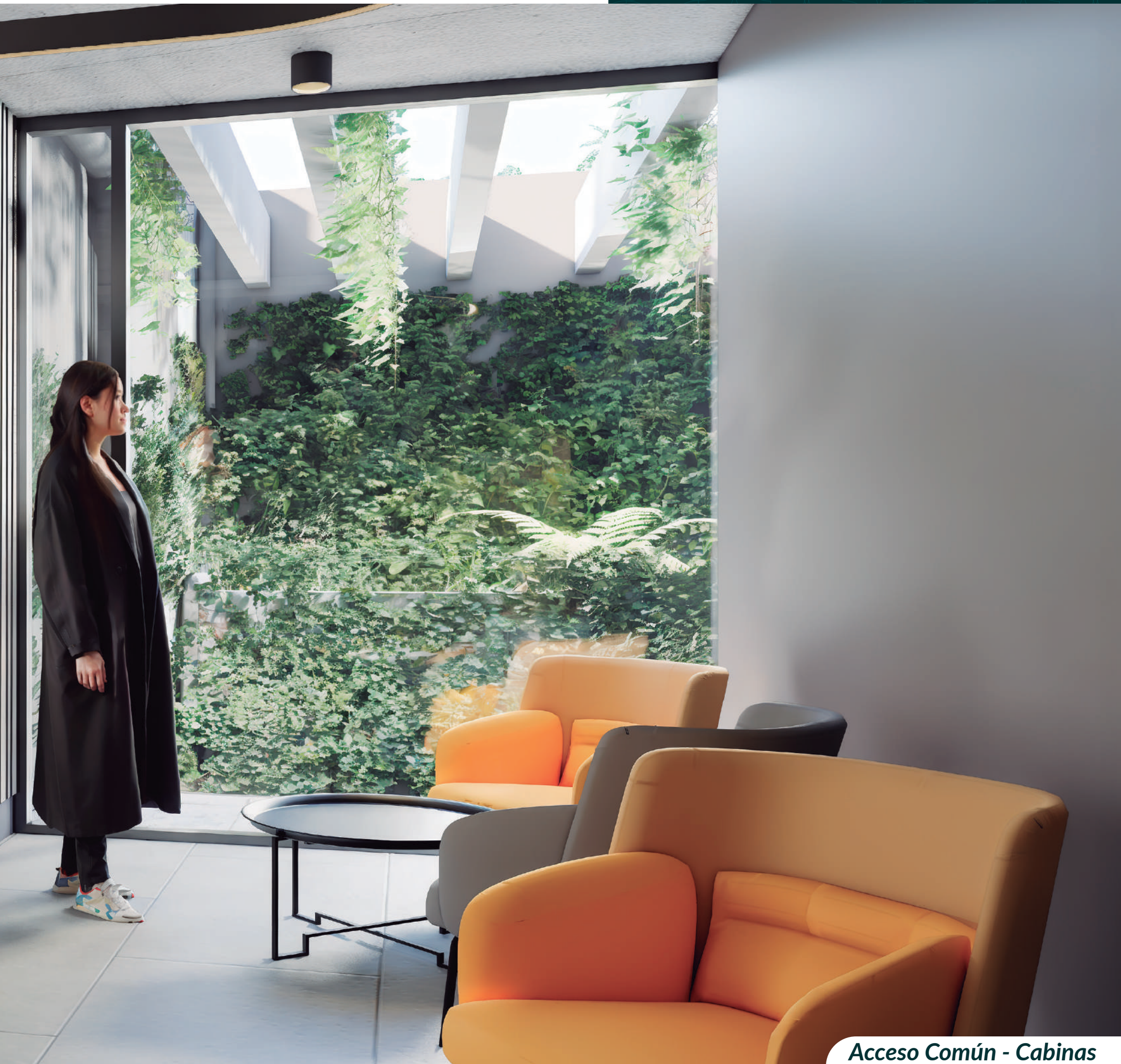
Acceso Común - Cabinas