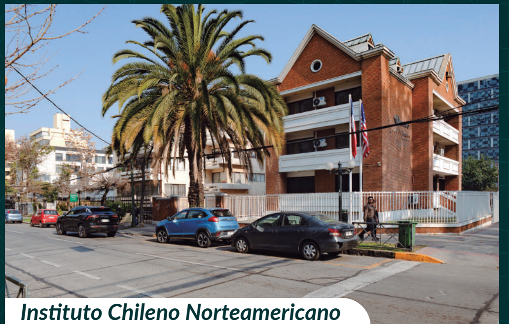
Instituto Chileno Norteamericano