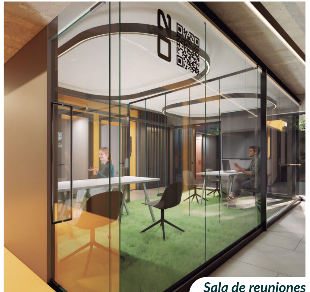
Sala de reuniones