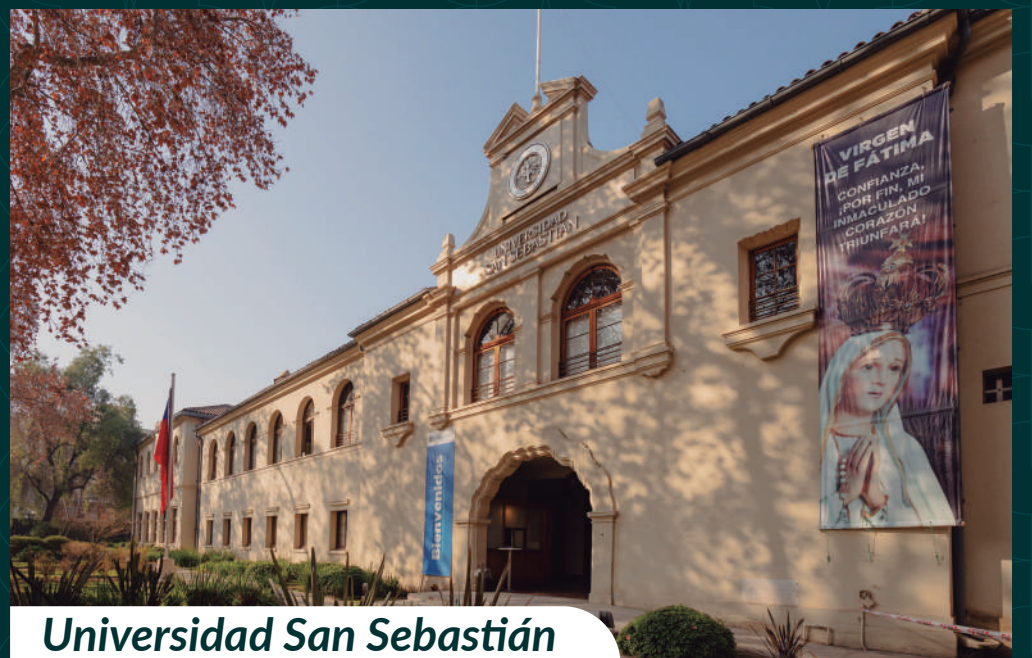
Universidad San Sebastián