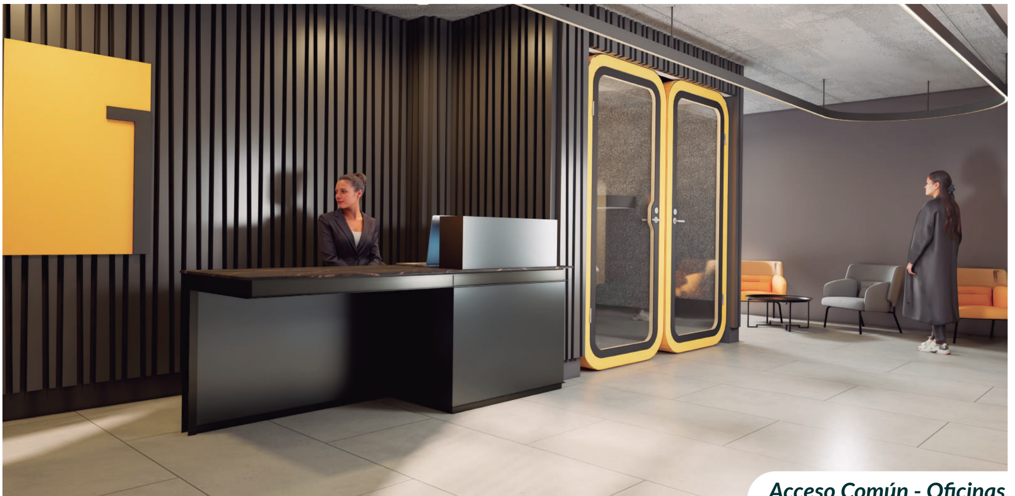
Acceso Común - Oficinas