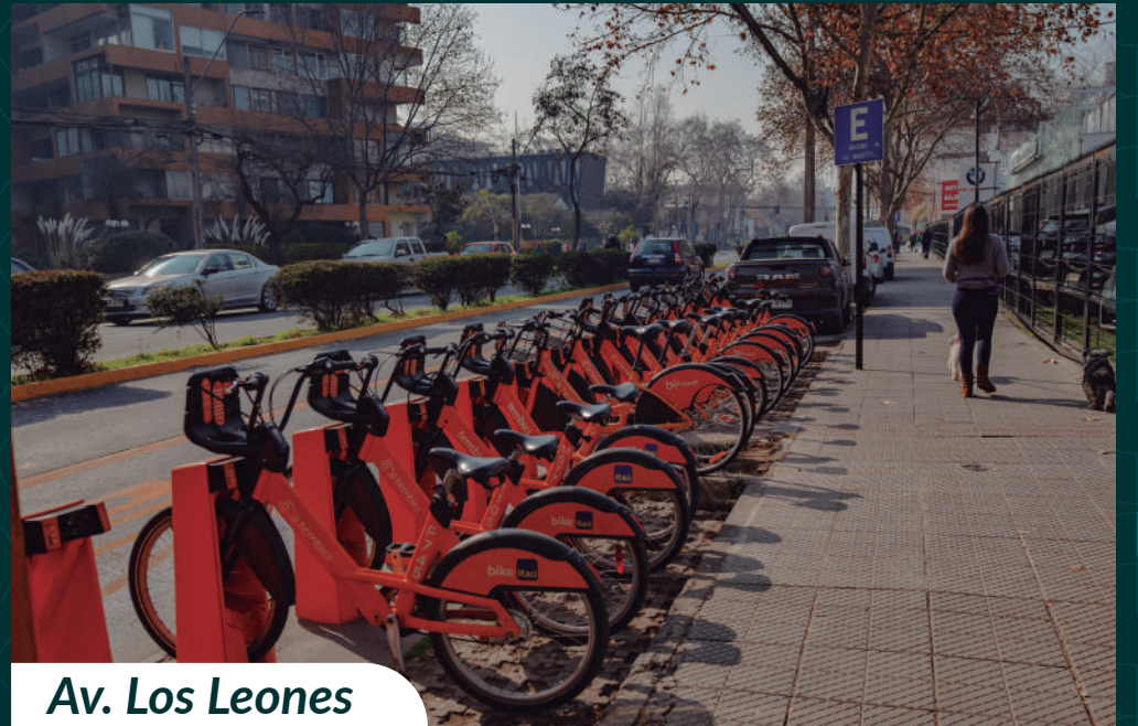
Av. Los Leones